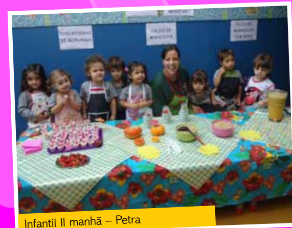
Infantil II manhã – Petra

Na Trilha os alunos aprendem desde cedo que uma boa alimentação traz inúmeros benefícios para a saúde. E, para possibilitar às crianças o acesso a uma variedade de receitas saudáveis, os alunos do Infantil II participam do projeto Gostosuras do Infantil II – Alimentação e Saúde. O objetivo é fazer com que elas conheçam a variedade de alimentos e seus benefícios. A atividade ainda é um momento para preparar receitas diversas. Nesse ano, a escola inovou e promoveu o Encontro Gastrô. Para o evento, cada turma elaborou um prato para os colegas e funcionários experimentarem e a ação foi um sucesso!