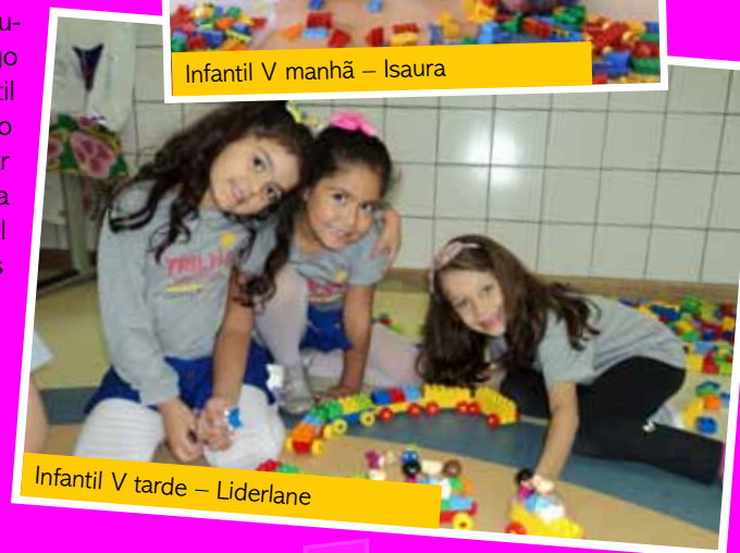
Infantil V tarde – Liderlane